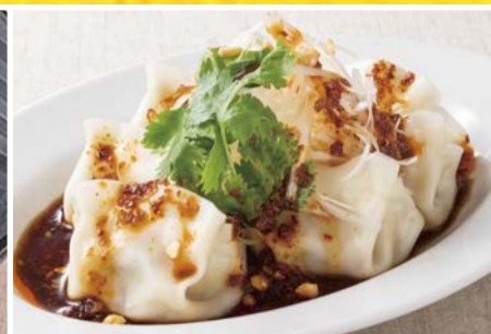
西安よだれ ひとくち水餃子