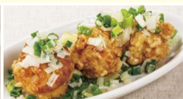
鶏の唐揚げ青葱炒め