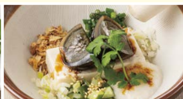
すり鉢ピータン豆腐