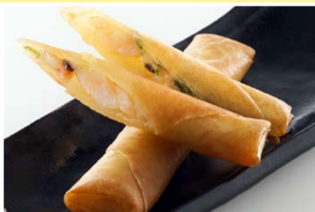
ぷりっぷりの海老春巻