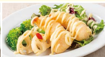
海老と野菜の マヨネーズソース