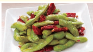
枝豆のペペロンチーノ