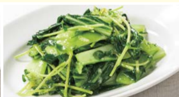
豆苗と青菜の にんにく炒め