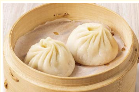
オリジナル小籠包