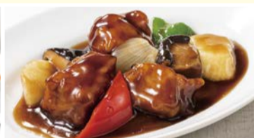
コクと香りの 黒酢酢豚