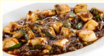
痺れる山椒ピリ辛 麻婆豆腐