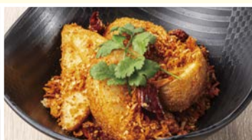
スパイシー 大魔王ポテト