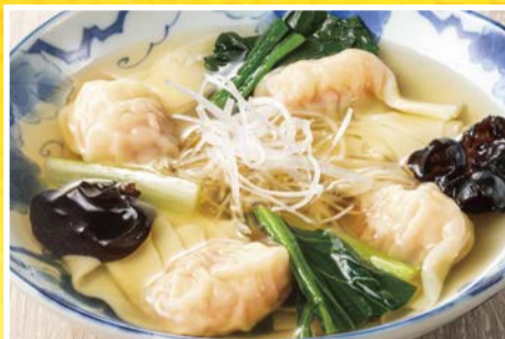
茹で手包みの 海老肉わんたん

生ビール(小) or ハイボール or レモンサワー or ウーロンハイ or 紹興酒 or ソフトドリンク