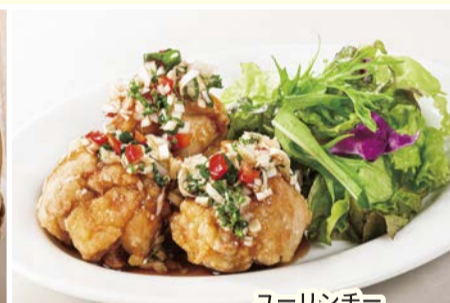
薬味たっぷり油淋鶏