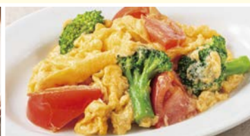
トマトとブロッコリーの 玉子炒め