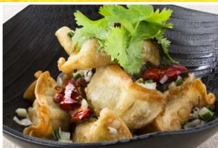
山椒塩で仕上げた 揚げひとくち餃子