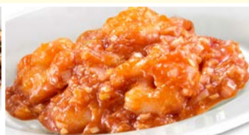
ぷりっぷりの 海老のチリソース