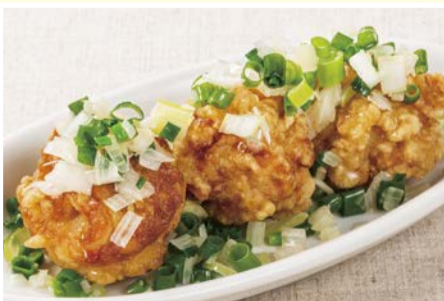
鶏の唐揚げ青葱炒め 495円(税込)