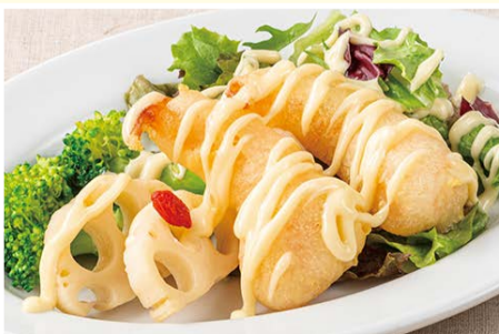
海老と野菜の マヨネーズソース 572円(税込)