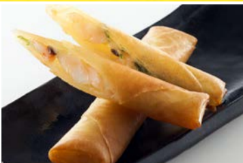
ぷりっぷりの海老春巻 〈2本〉 638円(税込)