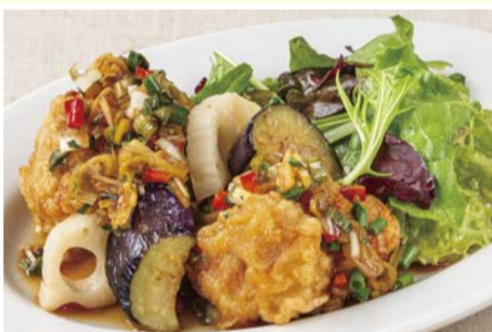
薬味たっぷり ユーリンチー 油淋鶏 〈小皿〉 550円(税込)