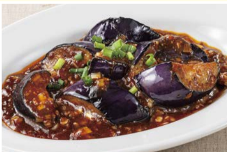
ピリ辛麻婆茄子 605円(税込)