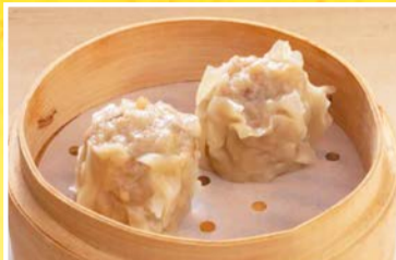
西安肉焼売 〈2個〉 440円(税込)