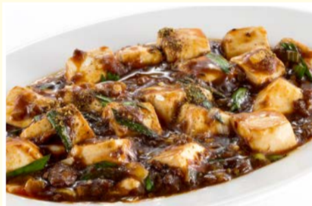
痺れる山椒ピリ辛 麻婆豆腐 〈小皿〉 550円(税込)