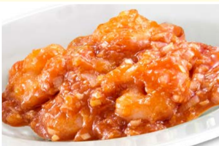
ぷりっぷりの 海老のチリソース 〈小皿〉 660円(税込)