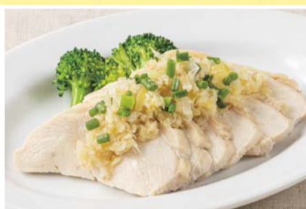
ジンジャー鶏 550円(税込)