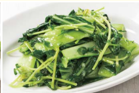
豆苗と青菜の にんにく炒め 〈小皿〉 550円(税込)