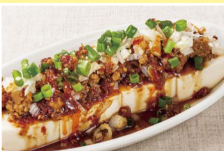
中華やっこ 462円(税込)