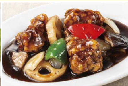
コクと香りの 黒酢酢豚 〈小皿〉 660円(税込)