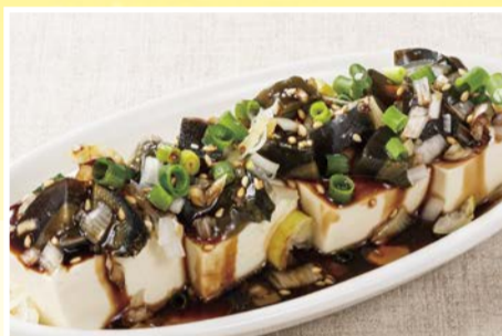
ピータン豆腐 462円(税込)