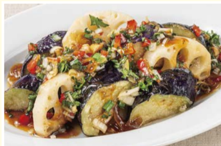
ユーリン 油淋茄子 495円(税込)