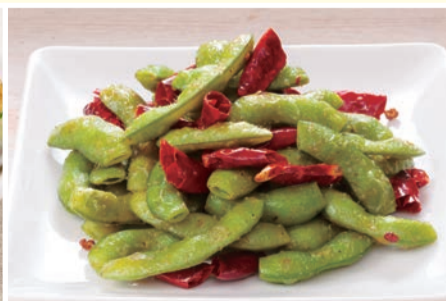
枝豆のペペロンチーノ 462円(税込)