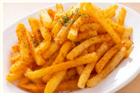
スパイシーポテト 418円(税込)