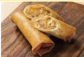
五目春巻 〈2本〉 638円(税込)