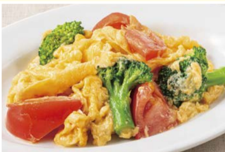
トマトとブロッコリーの 玉子炒め 528円(税込)