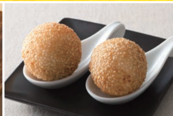
ごま団子 〈2個〉 396円(税込)