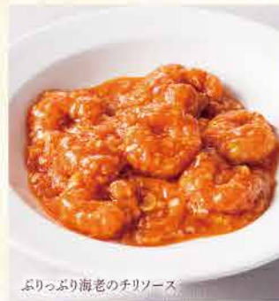
ふりっぶり海老のチリソース