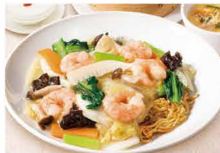
海老焼きそばセット