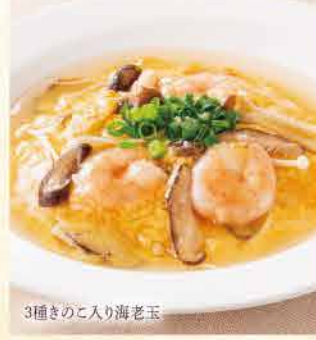
3種きのこ入り海老玉