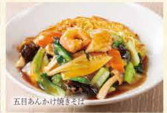
五目あんかけ焼きそば