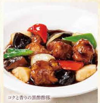
コクと香りの黒酢酢豚