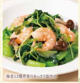
海老と2種青菜のあっさり塩炒め