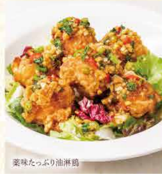
薬味たっぷり油淋鶏