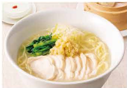
蒸し鶏と生姜の白湯麺 バイタンメン セット