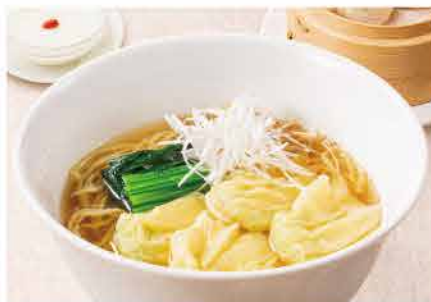
海老わんたん麺セット