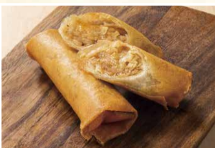
五目春巻 〈2本〉 605 円(税込)