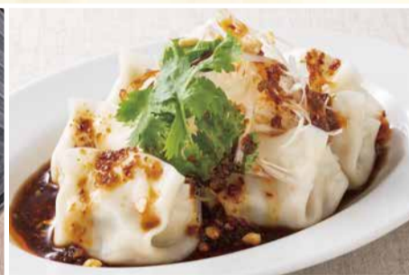
西安よだれ ひとくち水餃子 〈6個〉 495 円(税込)