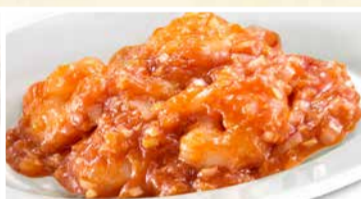
ぷりっぷりの 海老のチリソース 〈小皿〉 660 円(税込)