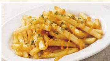
チェダーチーズの ポテトフライ 462円(税込)