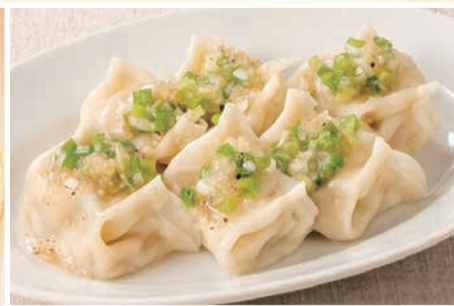
ねぎ塩 ひとくち水餃子 〈6個〉 495 円(税込)