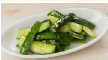
たたき胡瓜 462円(税込)