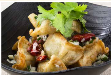
山椒塩で仕上げた 揚げひとくち餃子 〈6個〉 495 円(税込)