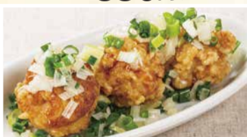
鶏の唐揚げ青葱炒め 495円(税込)