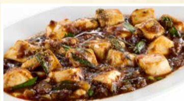
痺れる山椒ピリ辛 麻婆豆腐 〈小皿〉 550 円(税込)