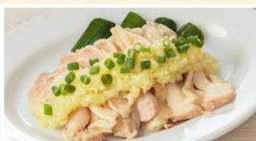
ジンジャー鶏 550円(税込)