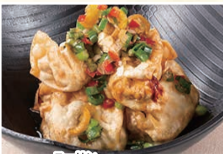
ユーリン 油淋ソースの 揚げひとくち餃子 〈6個〉 495 円(税込)