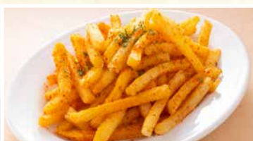
スパイシーポテト 396円(税込)