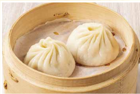
手包み小籠包 〈2個〉 550 円(税込)