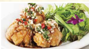
薬味たっぷり ユーリンチー 油淋鶏 〈小皿〉 550 円(税込)