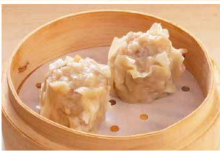
西安肉焼売 〈2個〉 440 円(税込)