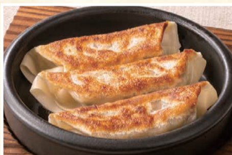
黒豚餃子 〈3個〉 429 円(税込)