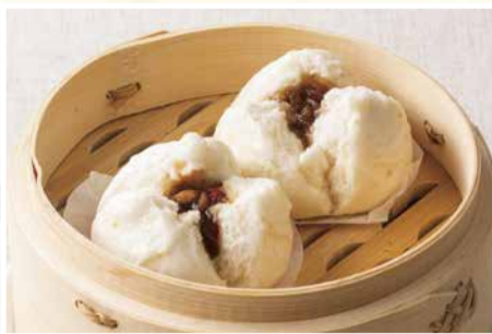
チャーシュー包 パオ 〈2個〉 528 円(税込)