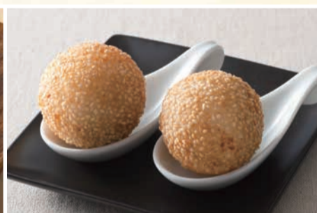
ごま団子 〈2個〉 396 円(税込)