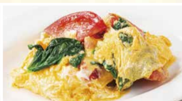
トマトと青菜の玉子炒め 528円(税込)