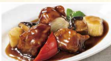
コクと香りの 黒酢酢豚 〈小皿〉 660 円(税込)