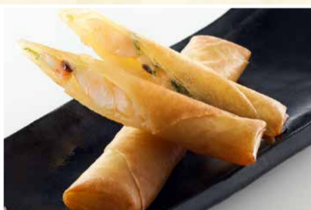
ぷりっぷりの海老春巻 〈2本〉 638 円(税込)