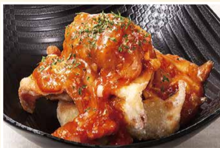
チーズチリソースの 揚げひとくち餃子 〈6個〉 528 円(税込)