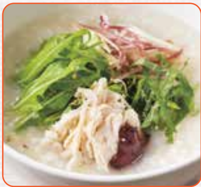
蒸し鶏とみよがのおかゆ梅味仕立て