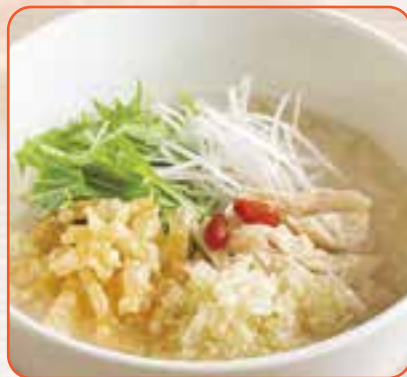
蒸し鶏ジンジャーのおかゆ