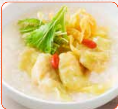
プリプリ海老わんたんのおかゆ