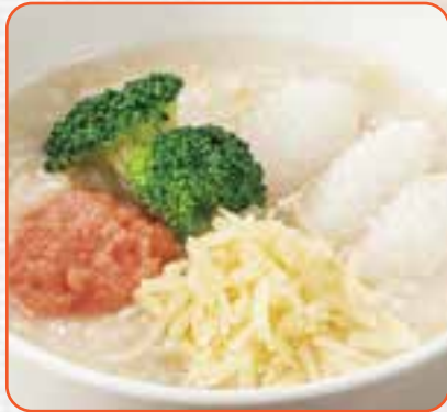
たらこととろ〜りチーズのおかゆ