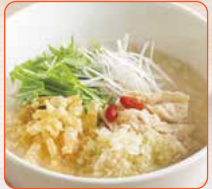
蒸し鶏ジンジャーのおかゆ