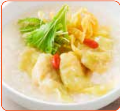
プリプリ海老わたんのおかゆ