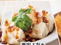
西安よだれ ひとくち水餃子 ＜6個＞ 486円