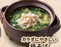
カラダにやさしい 鶏そば 880円