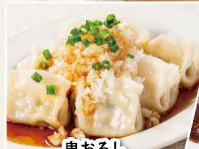
鬼おろし ポン酢ひとくち水餃子 ＜6個＞ 486円