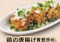
鶏の唐揚げ青葱炒め ＜3個＞ 486円