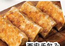
西安手包み 棒餃子 ＜4本＞ 496円