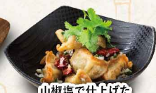
山椒塩で仕上げた 揚げひとくち餃子 ＜8個＞ 486円