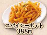
スパイシーポテト 388円