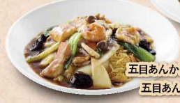
野菜たっぷり 五目あんかけ焼きそば 1,134円 五目あんかけご飯 1,134円