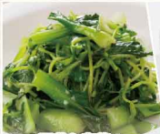
豆苗と青菜の にんにく炒め 918円 （小皿）496円