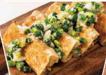
ねぎ塩コク旨餃子 ＜4本＞ 691円