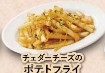
チェダーチーズの ポテトフライ 410円