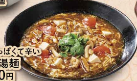
醤油味の酸っぱくて辛い 酸辣湯麵 990円