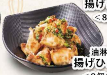
油淋ソースの 揚げひとくち餃子 ＜8個＞ 486円