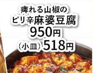
痺れる山椒の ビリ辛麻婆豆腐 950円 （小皿）518円