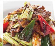
回鍋肉 918円 （小皿）518円