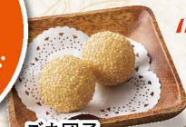
ごま団子 ＜2個＞ 388円