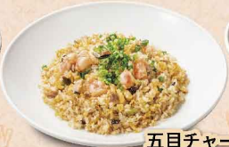
五目チャーハン 1,134円