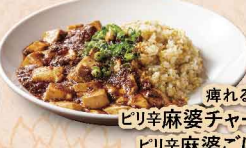
痺れる山椒の ビリ辛麻婆チャーハン 1,134円 ビリ辛麻婆ごはん 1,080円