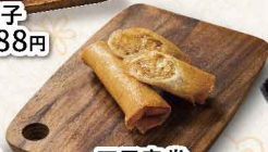
五目春巻 ＜2本＞ 518円