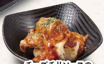
チーズソースの 揚げひとくち餃子 ＜8個＞ 518円