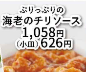
ぶりっぶりの 海老のチリソース 1,058円 （小皿）626円