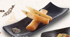
ぶりっぶりの 海老春巻 ＜2本＞ 540円