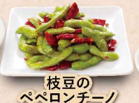
枝豆の ペペロンチーノ 410円