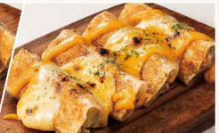
Wチーズ焼き餃子 ＜4本＞ 712円