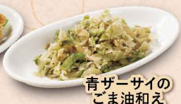
青ザーサイの ごま油和え 345円