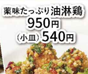
薬味たっぷり油淋鶏 950円 （小皿）540円