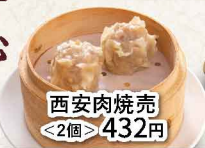
西安肉焼売 ＜2個＞ 432円