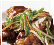
コクと香りの黒酢鶏 972円 （小皿）518円