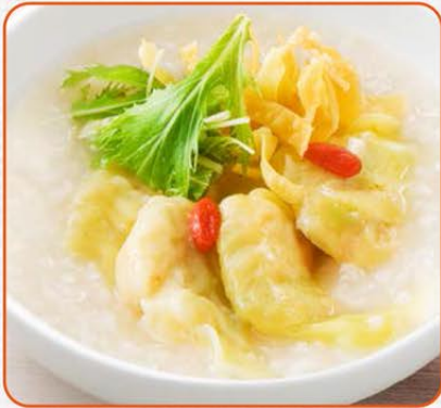
プリプリ海老わたんのおかゆ