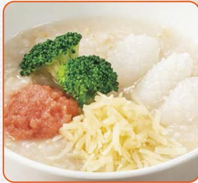
たらこチーズのおかゆ