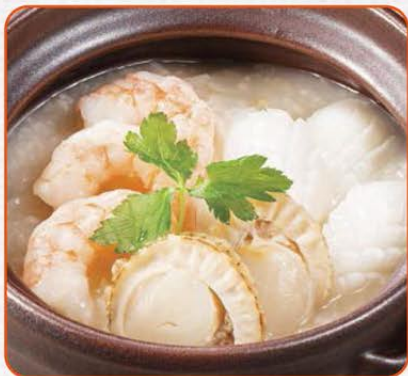
三種海鮮のおかゆ