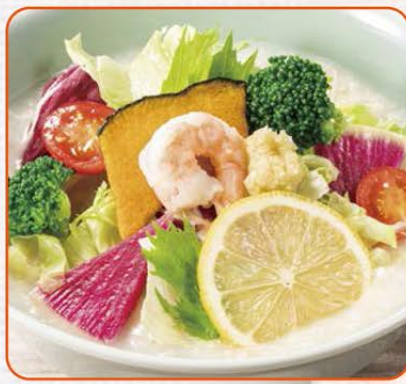
8種野菜のベジおかゆ