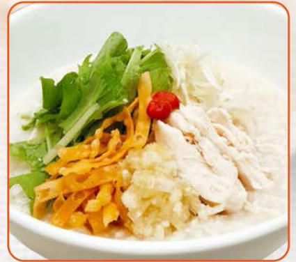
蒸し鶏と生姜のおかゆ