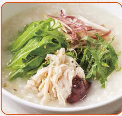
蒸し鶏とみょうがのおかゆ梅味仕立て