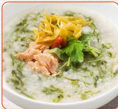
鮭と青のりの磯風味おかゆ