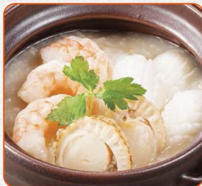
三種海鮮のおかゆ