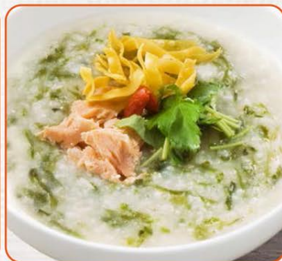
鮭と青のりの磯風味かゆ