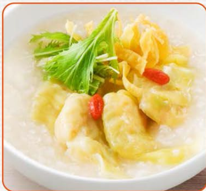
ぷりぷり海老わたんのおかゆ