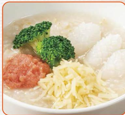
たらことろ〜りチーズのおかゆ