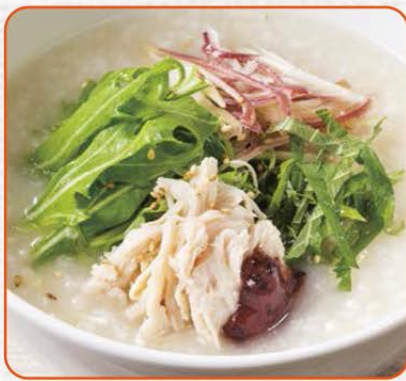
蒸し鶏とみょうがのおかゆ梅味仕立て