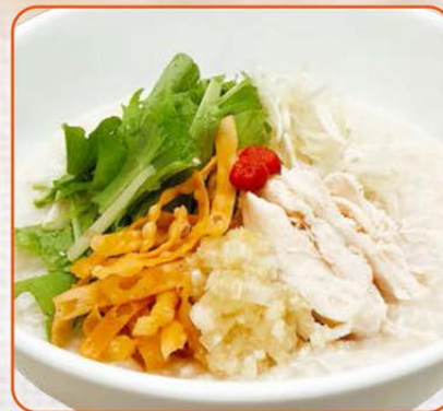
蒸し鶏ジンジャーのおかゆ