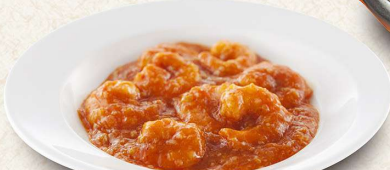
ぶりっぶりの海老のチリソース 993円／(小皿)626円