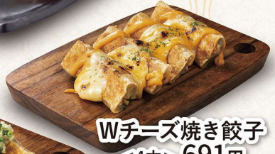
Wチーズ焼き餃子 ＜4本＞691円