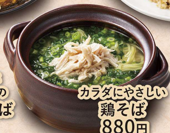
カラダにやさしい 鶏そば 880円