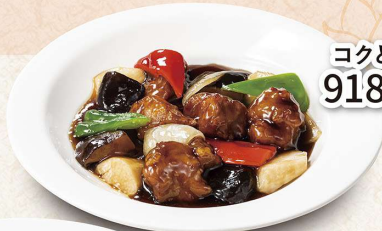
コクと香りの黒酢酢豚 918円／(小皿)561円