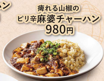
痺れる山椒の ピリ辛麻婆チャーハン 980円