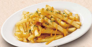
CHEDDARチーズの ポテトフライ 410円