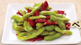
枝豆の ペペロンチーノ 410円