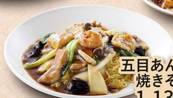
五目あんかけ 焼きそば 1,134円