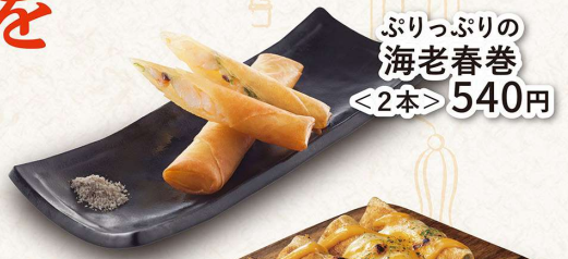
ぶりっぶりの 海老春巻 ＜2本＞540円