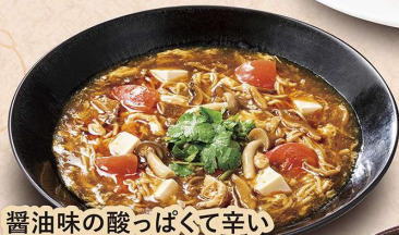
醤油味の酸っぱくて辛い 酸辣湯麺 990円