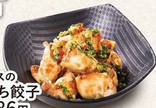
油淋ソースの 揚げひとくち餃子 ＜8個＞486円