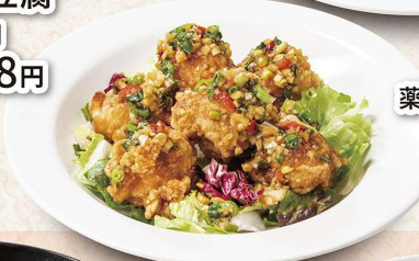
薬味たっぷり油淋鶏 918円 (小皿)518円