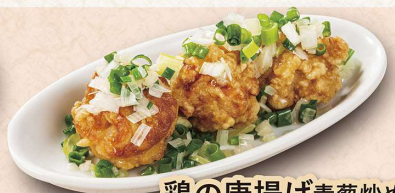
鶏の唐揚げ青葱炒め ＜3個＞432円