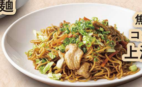
焦がし醤油と コク旨カキ油の 上海焼きそば 880円