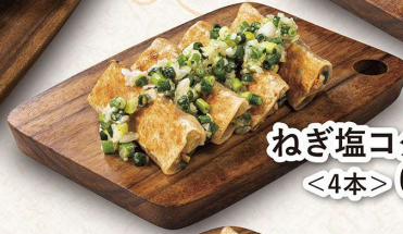
ねぎ塩コク旨餃子 ＜4本＞691円