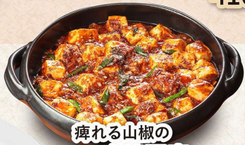
痺れる山椒の ピリ辛麻婆豆腐 918円 (小皿)518円