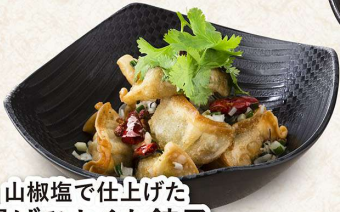
山椒塩で仕上げた 揚げひとくち餃子 ＜8個＞486円