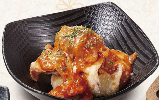
チーズチリソースの 揚げひとくち餃子 ＜8個＞518円