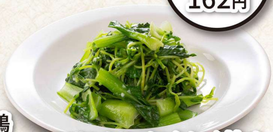
豆苗と青菜のにんにく炒め 918円／(小皿)496円