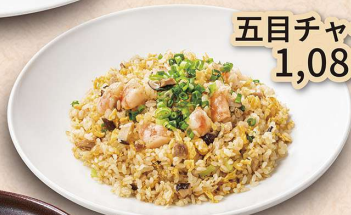
五目チャーハン 1,080円