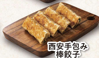
西安手包み 棒餃子 ＜4本＞475円