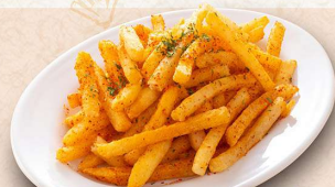
スパイシーポテト 388円