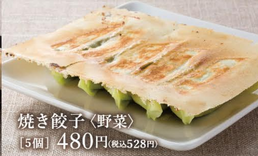
焼き餃子<野菜> [5個] 480円(税込528円)