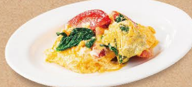
トマトとほうれん草の玉子炒め 430円(税込473円)