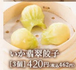
いか翡翠餃子 [3個] 420円(税込462円)