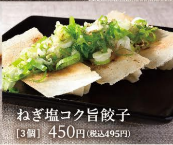
ねぎ塩コク旨餃子 [3個] 450円(税込495円)