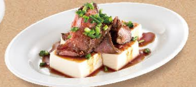
ローストビーフ豆腐 540円(税込594円)