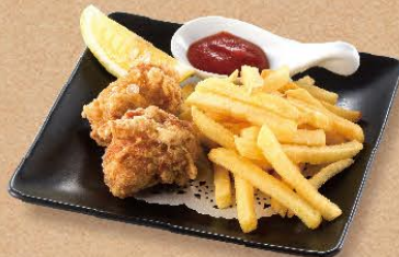
唐揚げ&フライドポテト 450円(税込495円)