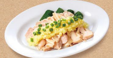
蒸し鶏のしょうが葱ソース 460円(税込506円)