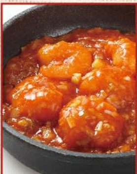
海老のチリソース