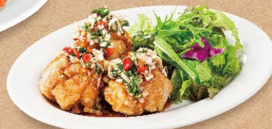
ユーリンチー 薬味たっぷり油淋鶏 450円(税込495円)