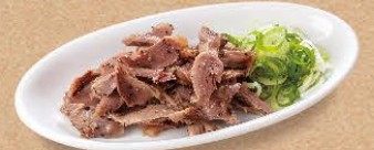
砂肝のごま油あえ 360円(税込396円)