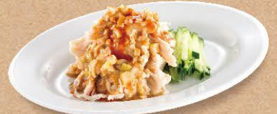
バンバンジー 450円(税込495円)