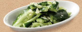
たたき胡瓜 360円(税込396円)