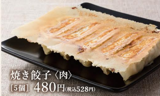
焼き餃子<肉> [5個] 480円(税込528円)