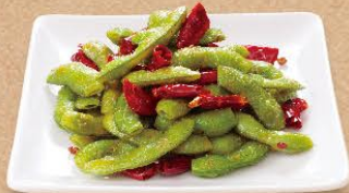
枝豆のペペロンチーノ 360円(税込396円)