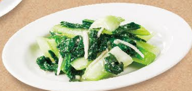
青菜のにんにく炒め 460円(税込506円)