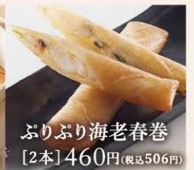
ぶりっぶり海老春巻 [2本] 460円(税込506円)