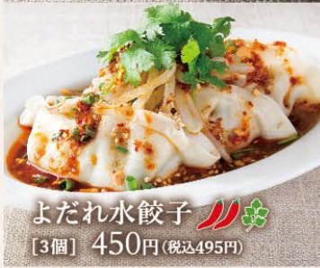
よだれ水餃子 [3個] 450円(税込495円)