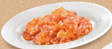
ぶりっぶり 海老のチリソース 540円(税込594円)