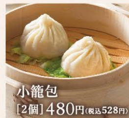
小籠包 [2個] 480円(税込528円)