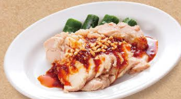
やみつきよだれ鶏 460円(税込506円)