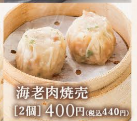
海老肉焼売 [2個] 400円(税込440円)