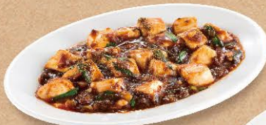
四川麻婆豆腐 450円(税込495円)