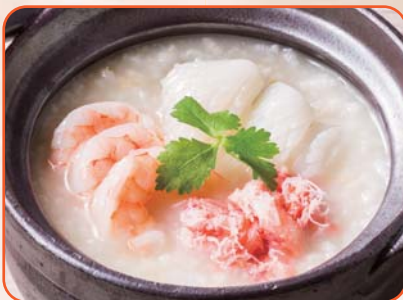
三種海鮮のおかゆ