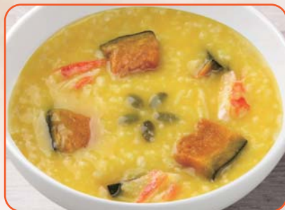
かぼちゃとカニの黄色いおかゆ