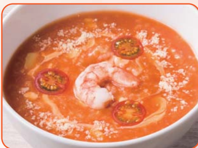
海老とチーズのトマトのおかゆ