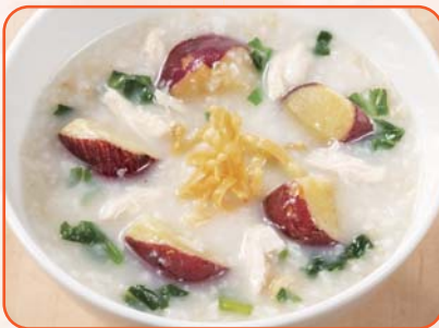
蒸し鶏と青菜のさつま芋かゆ