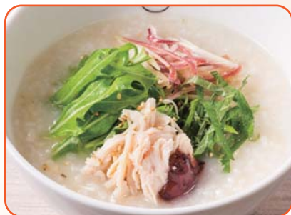
蒸し鶏とみょうがのおかゆ梅味仕立て