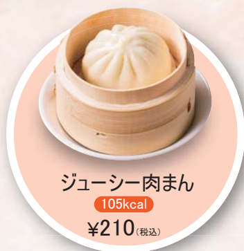
ジューシー肉まん