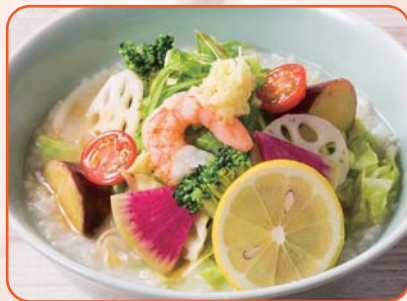
8種野菜のベジかゆ