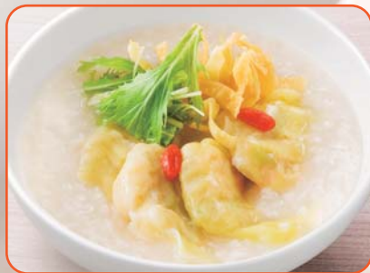
プリプリ海老わたんのおかゆ