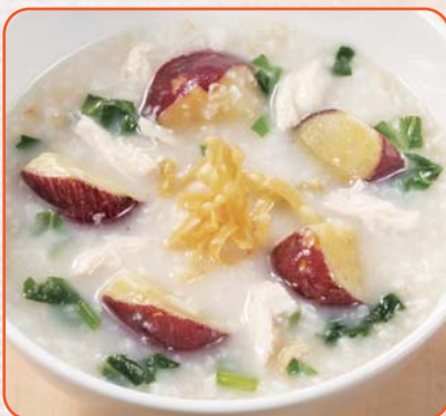
蒸し鶏と青菜のさつま芋かゆ