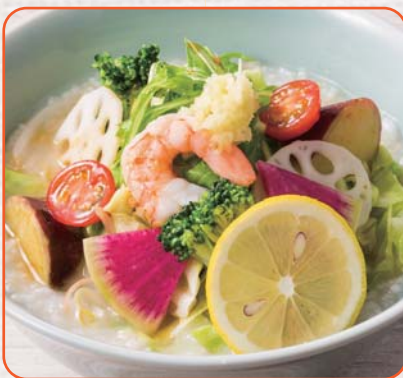
8種野菜のベジかゆ