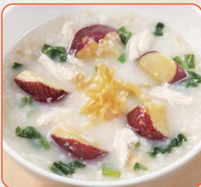
蒸し鶏と青菜のさつま芋かゆ