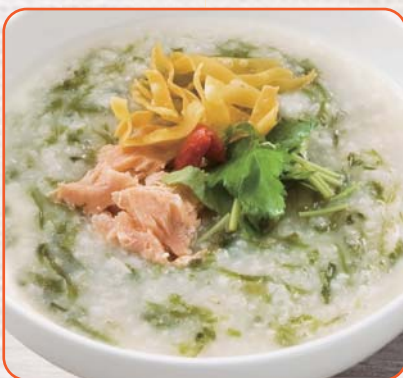
鮭と青のりの磯風味かゆ