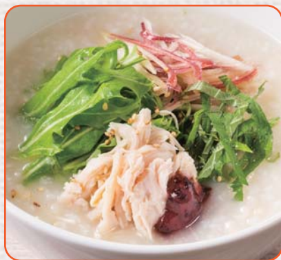
蒸し鶏とみょうがのおかゆ梅味仕立て