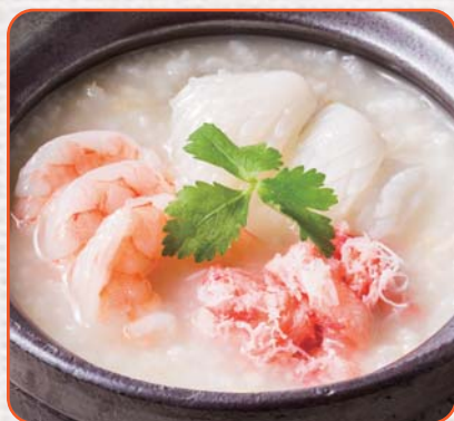
三種海鮮のおかゆ