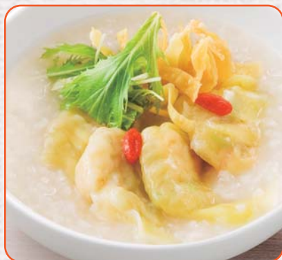
プリプリ海老わんたんのおかゆ