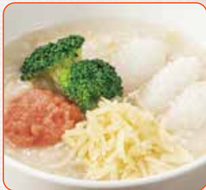
たらこチーズのおかゆ