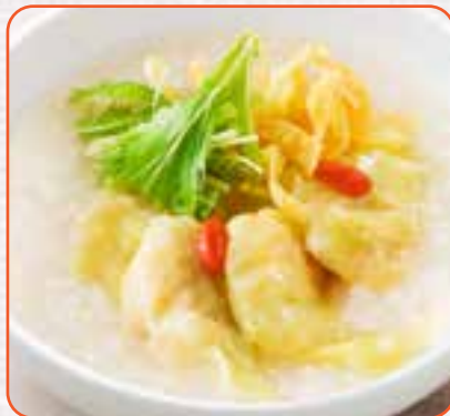
プリプリ海老わんたんのおかゆ