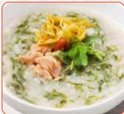
鮭と青のりの磯風味かゆ