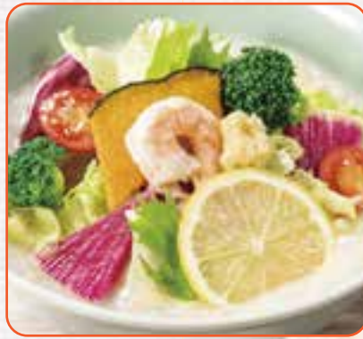
8種野菜のベジかゆ