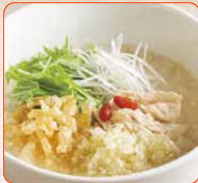
蒸し鶏ジンジャーのおかゆ