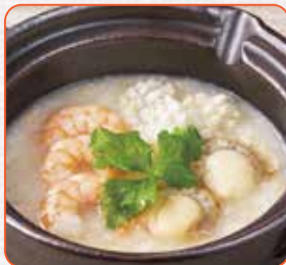
三種海鮮のおかゆ